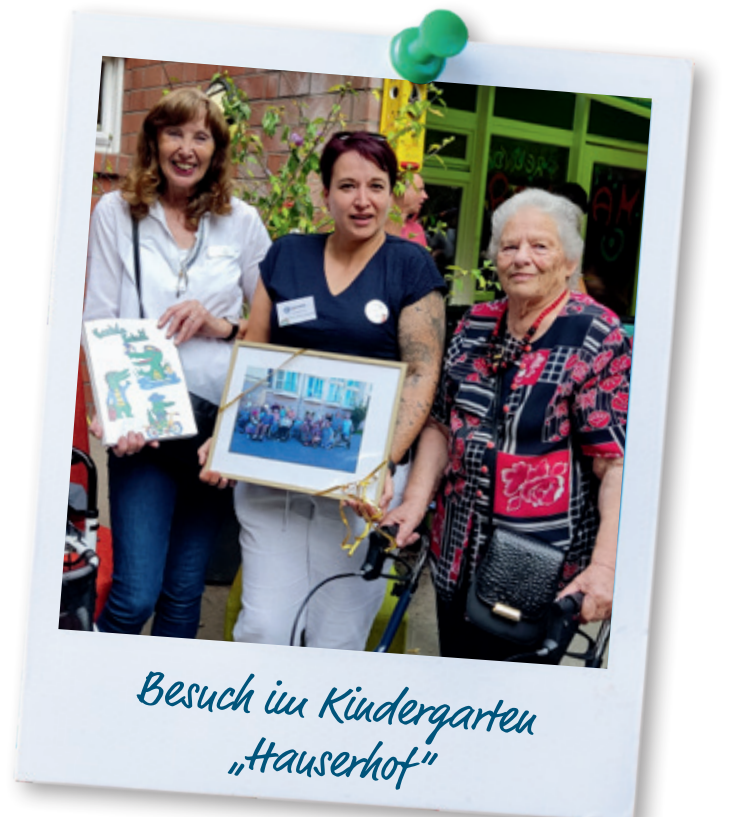
Besuch im Kindergarten „Hauserhof“

Schön war es, Jung und Alt – über die Generationen hinweg – beim Feiern zu erleben. Nach einer Stärkung am reichhaltigen Kuchenbuffet machte man sich bereit zur Heimkehr.