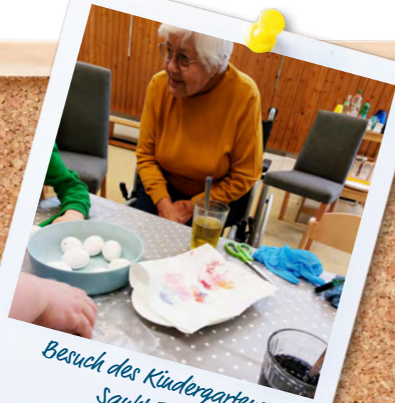
Besuch des Kindergartens Sankt Josef

Gemeinsam mit dem Betreuungsteam besuchten die Bewohner*innen der BELLINI Senioren-Residenz den katholischen Kindergarten St. Josef und folgten damit gerne einer herzlichen Einladung. Bei einem etwa halbstündigen Spaziergang bei angenehmen Temperaturen machte sich die Gruppe zu Fuß auf den Weg. Im Gepäck befanden sich liebevoll vorbereitete Überraschungen: abgekochte Eier und Schokohasen für die Kinder. In der Turnhalle wurden anschließend gemeinsam Ostereier gefärbt und kreativ gestaltet. Die bunten Kunstwerke von Jung und Alt konnten sich sehen lassen und sorgten für strahlende Gesichter. Begleitet von fröhlichen Gesprächen und österlichen Liedern entstand ein rundum gelungener Tag voller Herzlichkeit. Die Vorfreude auf das nächste Wiedersehen zur Weihnachtszeit ist bereits groß.