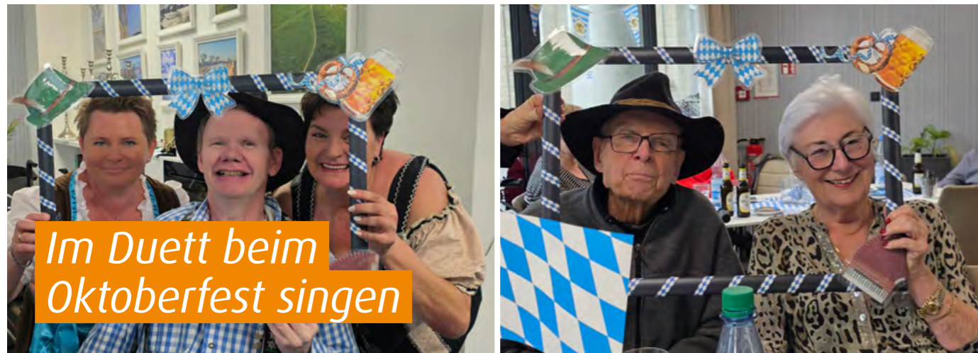
Im Duett beim Oktoberfest singen

BELLINI Neuwied brachte im Oktober 2025 bayerische Lebensfreude nach Rheinland-Pfalz und feierte ein fröhliches Oktoberfest in der Residenz. Im blau-weiß geschmückten Restaurant versammelten sich Bewohnerinnen, Bewohner und Gäste zu einer echten Gaudi mit Musik, guter Stimmung und kulinarischen Genüssen. Den musikalischen Auftakt gestaltete der hauseigene BELLINI Neuwied-Chor mit bekannten Liedern wie dem „Kufsteinlied“, „Bergvagabunden“ und „Heidi“. Im weiteren Verlauf sorgte Alleinunterhalter Friedl Fox für